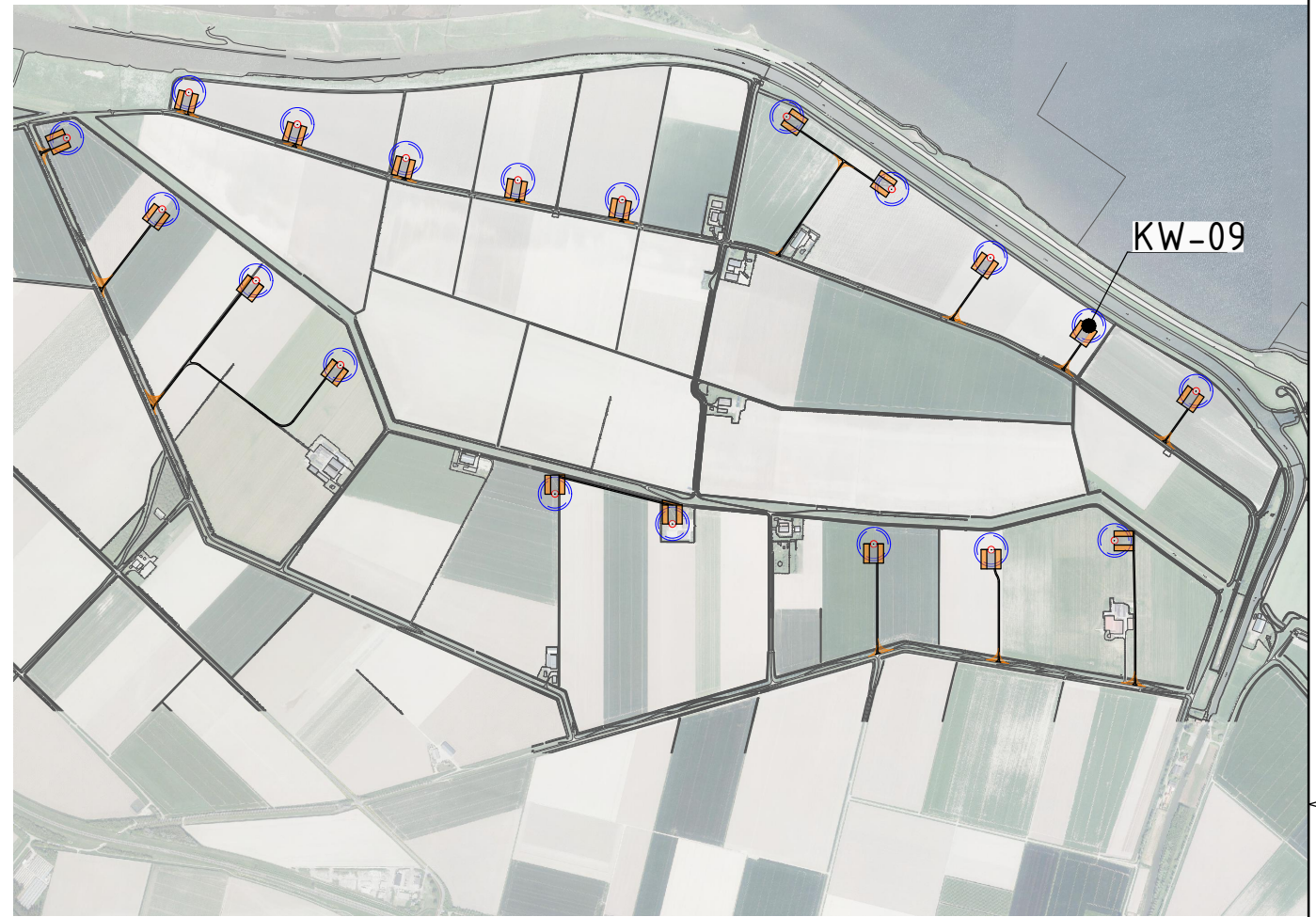
SITUATIE schaal 1:25.000